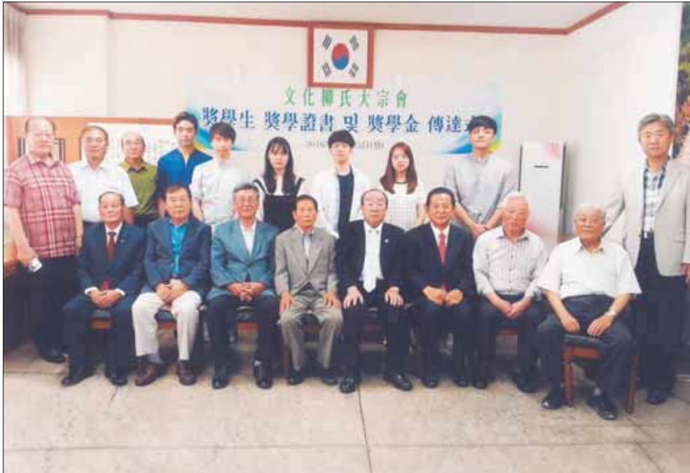
16년도 대종회 장학금 전달식 (2016. 7. 25)