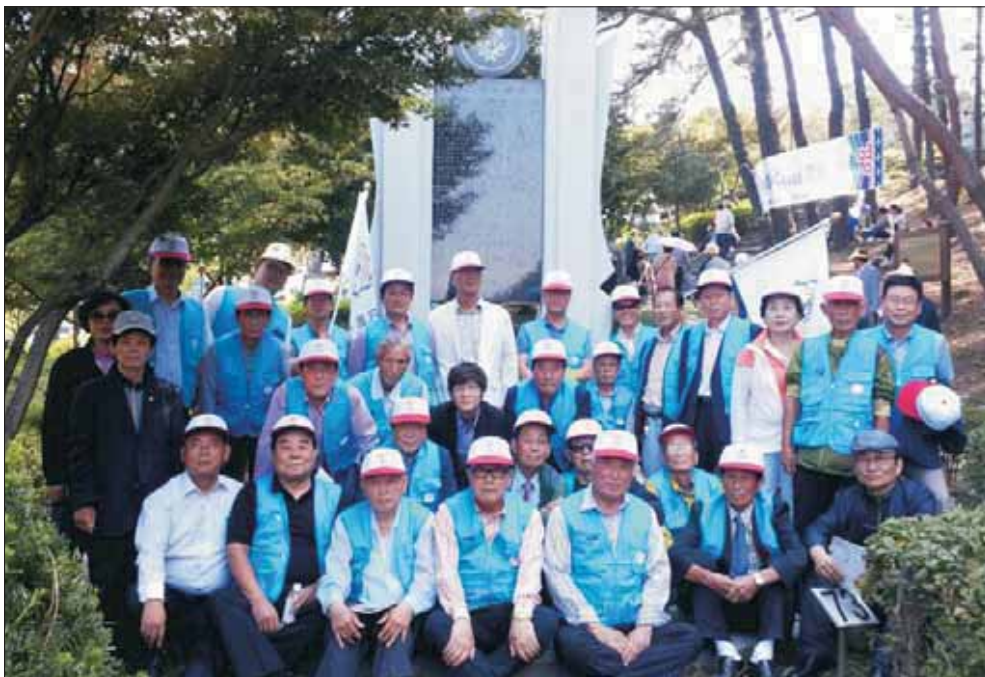
뿌리공원 효문화뿌리축제 (2016. 9. 23)