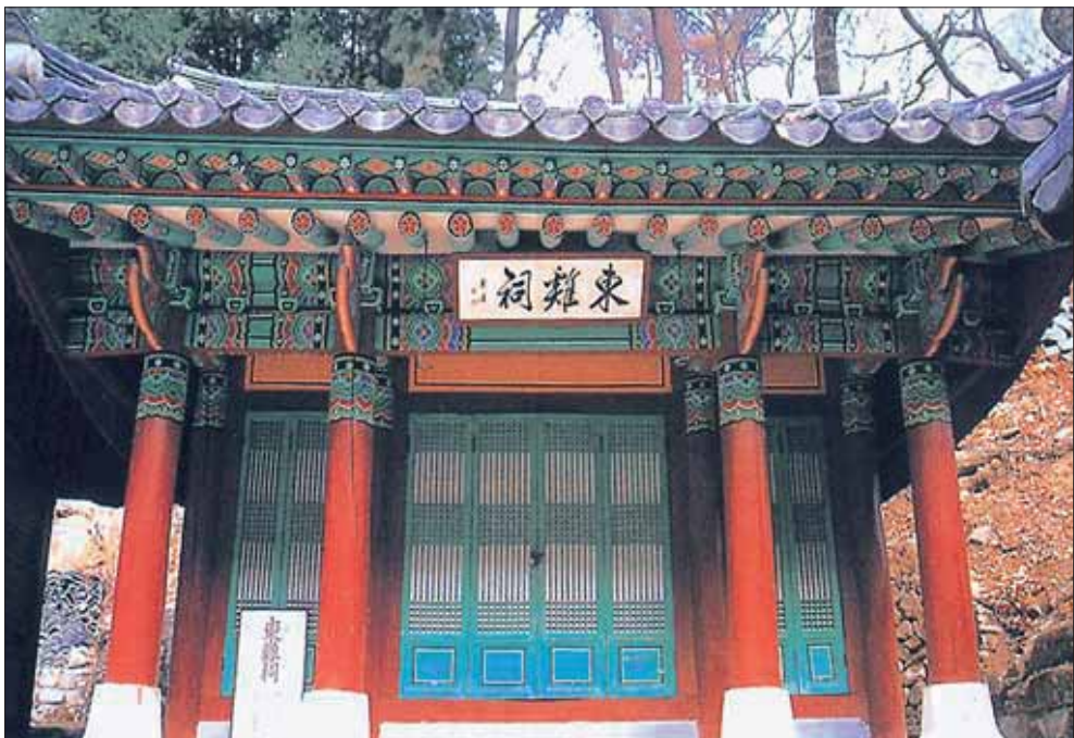
東雞祠（公州市 鷄龍山）