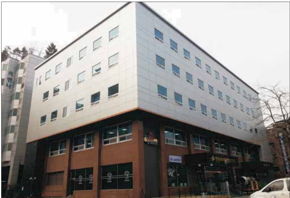
松庵公 宗중 회관

지난 1976년 4월 서울시의 도시확장으로 인하여 서초구 방배동으로부터 송암상공 및 이하 수대의 묘소를 이 곳으로 이장하고 그로부터 20여년 후 묘하의 퇴락한 재실을 철거한 후 그 부지에 재실 7간 (40평)과 외삼문 협문 등을 신축하여 사정문각이라 편액하고 2003년 10월 낙성식을 가졌다. 그리고 10년 후 2013년 11월 재실 입구에 홍살문을 세웠다.