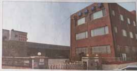
대구시 달성구에 있는 류림산업 본사 모습

CHQ와이어는 재질소에서 생산된 특수강 선재를 사용해 산재/피막(피막처리), 선선(철을 단게 늘리는 작업), 열처리 작업을 통해 다양한 종류와 제품으로 만들어지고 있다. 원료소재와 생산공정에 따라 생산되는 제품은 천차만별이다. 다육이 등의 소재를 사용해도 공정의 조합에 따라 생산되는 제품의 선질은 크게 달라진다.