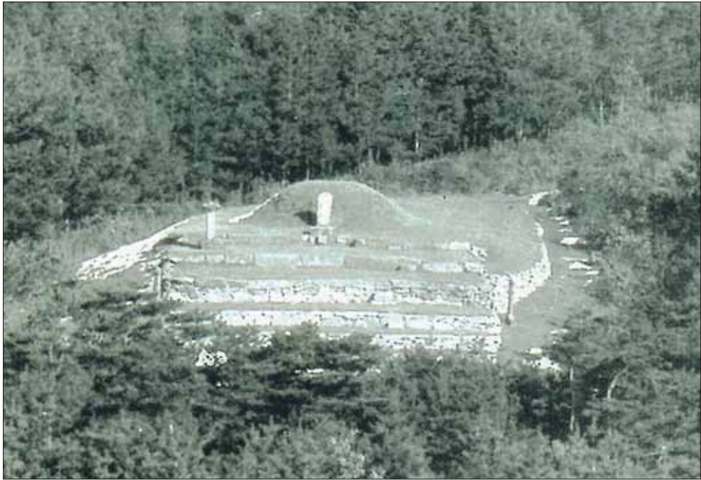
1943년 당시 柳陵 사진 (文化 九月山)