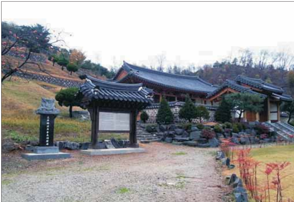
松菴相公脚下四旌門閣 경기도 안산시 단원구 와동 67-5