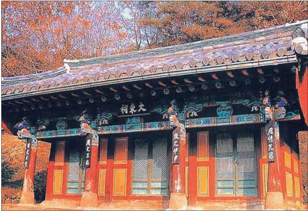
大東祠（光州市 東湖洞）