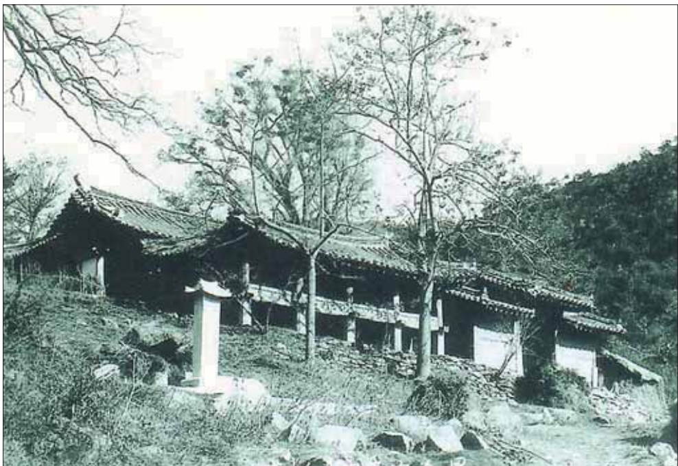
소실되기 전 柳陵재실 (敬思樓, 文化 九月山)