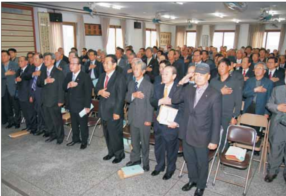
16년도 춘계 총회 국민의례