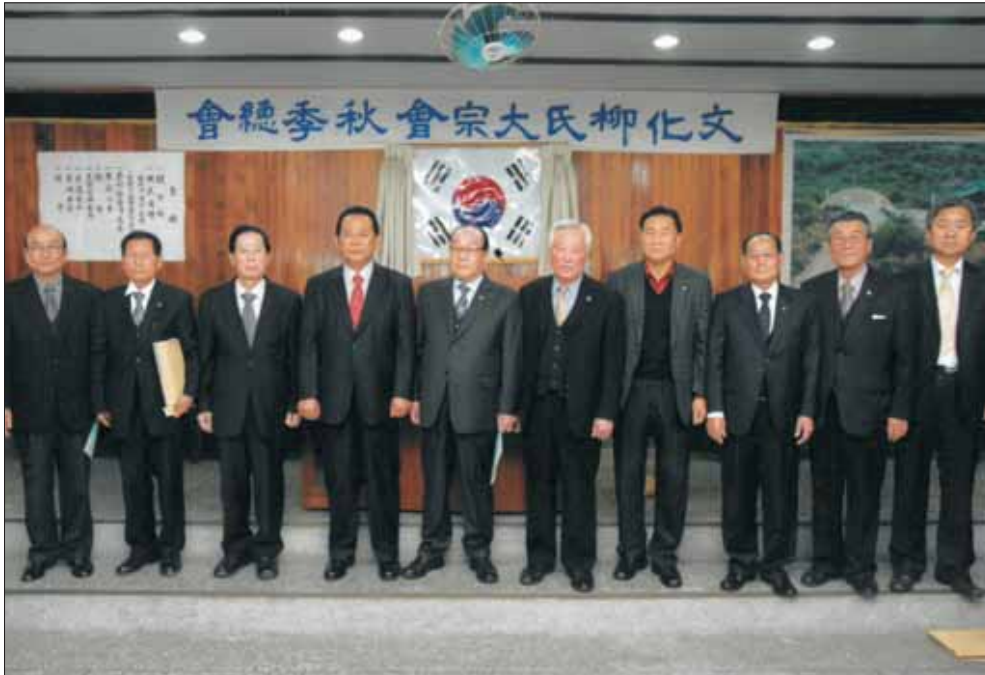
15년도 추계 총회