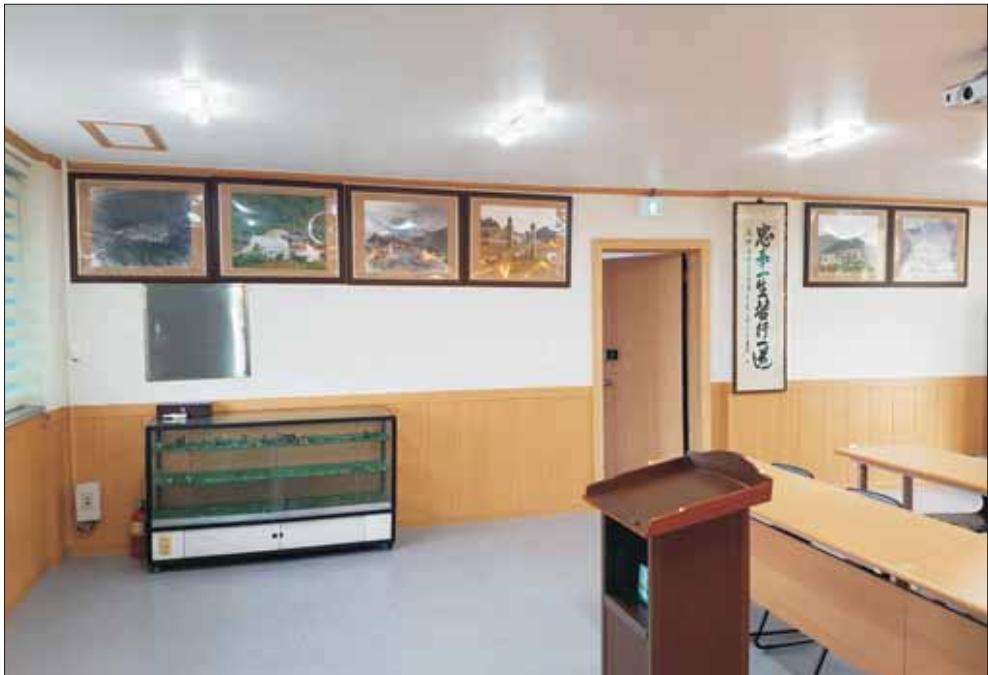
(주) 柳林産業 본사 내부

여 1986년 류림산업을 설립, 경영하였다. 그 후 1991년~2002, 초·2·3대까지 대구광역시 달서구 의회의원에 당선되어 3선 의원으로서 구의회의장에 피선, 지역사회의 공익사업에 이바지한 바 컸으며, 퇴임 후에 역시 사업에 전념하여 강소기업으로 육성 발전시키고 있다.