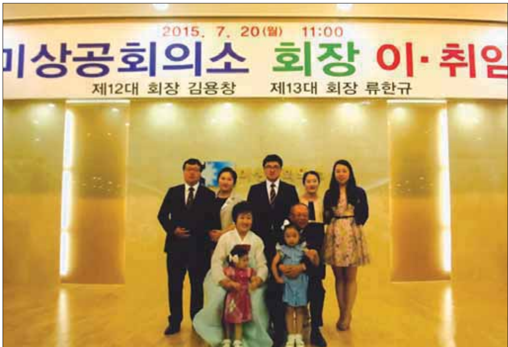
구미상공회의소 회장 가족

실 근면하고 부단한 노력가로서 사업에 성공하여 (주) 예일산업 대표이사로 재임 중, 구미상공회의소 회장에 피선된 지역사회의 큰 인물이다.