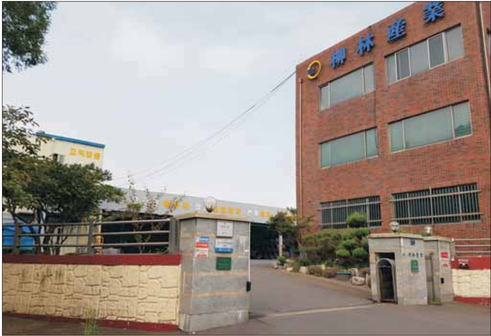
(주) 柳林産業 본사 전경