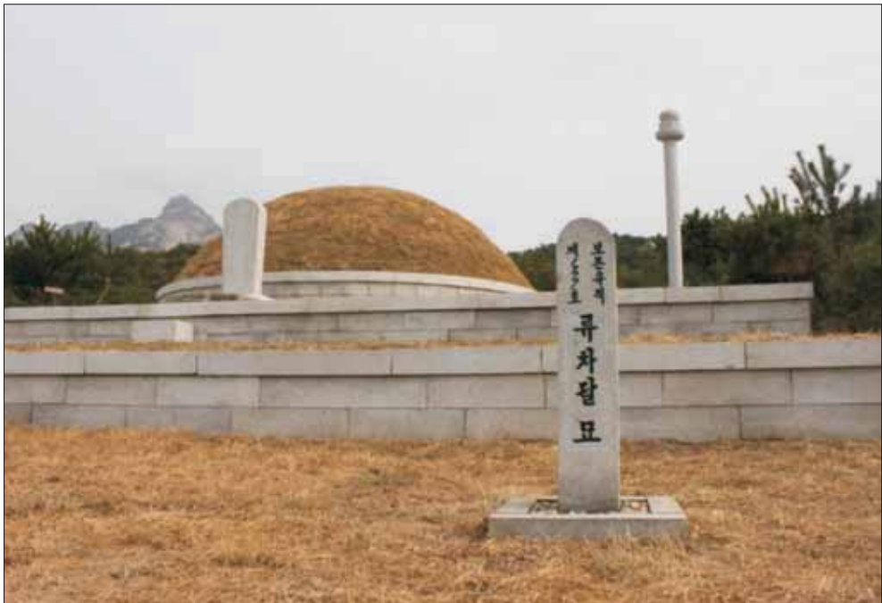
柳陵 앞에 세워진 보존유적 표식비